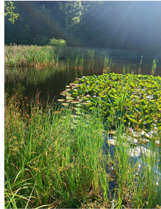
FRAU HOLLE TEICH auf dem Hohen Meißner